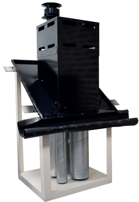
Combikap hellend dak in combinatie met indekstuk