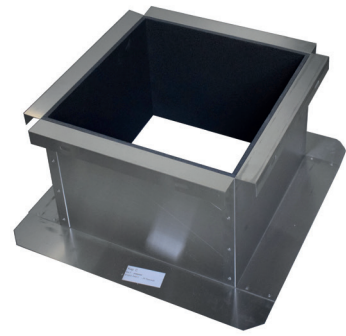
Plakplaat voor plat dak