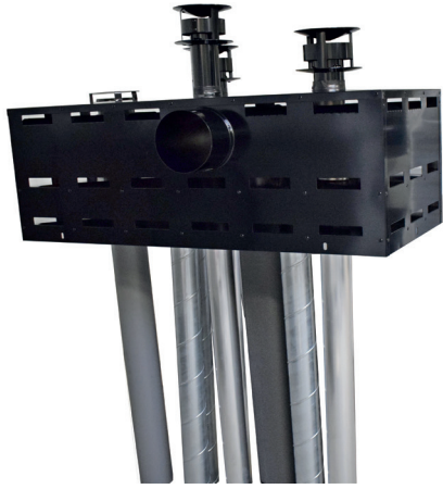
Combikap plat dak, met bocht voor aanzuig