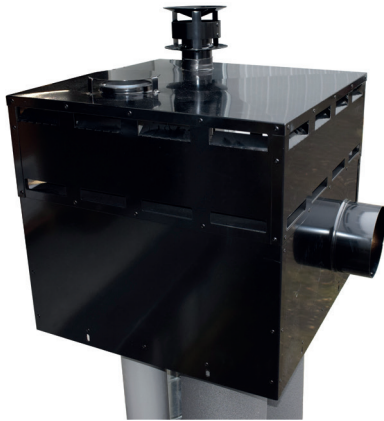
Combikap plat dak, met plenumbak voor aanzuig