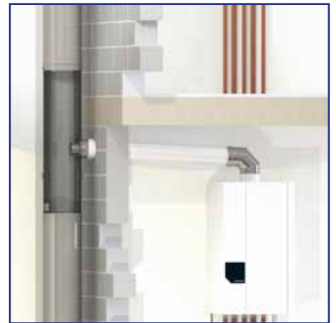
Aansluitement naar de CV-ketel(s) Élément de raccordement à la (aux) chaudière(s)