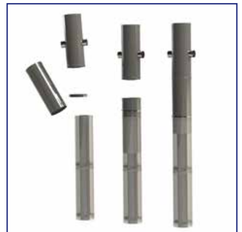
Regelbaar element dat zich aanpast aan iedere verdiepingshoogte Élément réglable s'adaptant à toutes les hauteurs d'étage