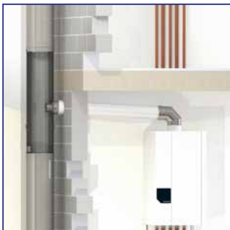
Aansluitement naar de CV-ketel(s) Élément de raccordement à la (aux) chaudière(s)

BUITENOPSTELLING CONFIGURATION EXTÉRIEURE